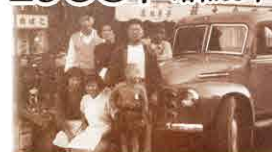
前身の「府中マーケット」を出店