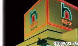
引野店にて24時間営業を開始