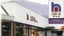
社名を「ハローズ」に変更